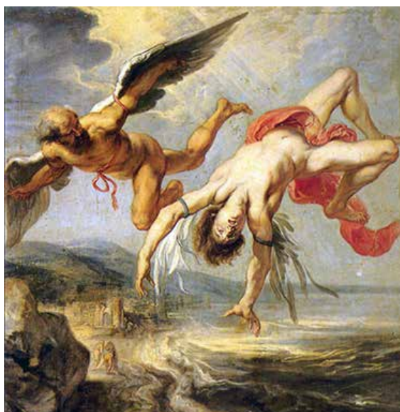
La chute d'Icare, Peter Jacob Gowy, d'après Rubens