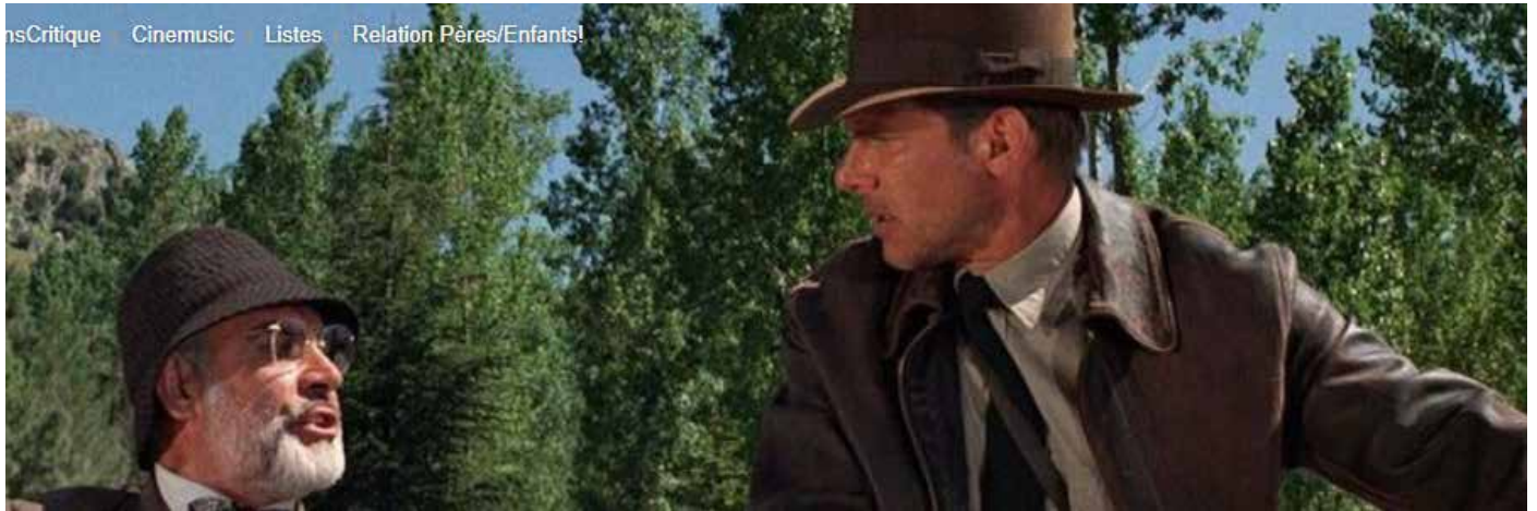
Photogramme Indiana Jones et la dernière croisade, de Steven Spielberg, Sean Connery et Harrison Ford