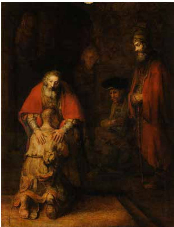
Rembrandt, le retour du fils prodigue