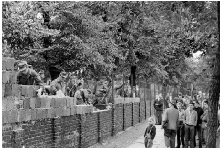
Habitants de l'Ouest de Berlin regardant des ouvriers de l'Est construire le mur, en août 1961.

https://img.lemde.fr/2014/08/12/605/0/3543/1772/664/0/75/0/ill_4470573_dc7a_liberation3.jpg