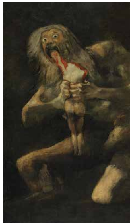
Goya, Saturne dévorant un de ses fils