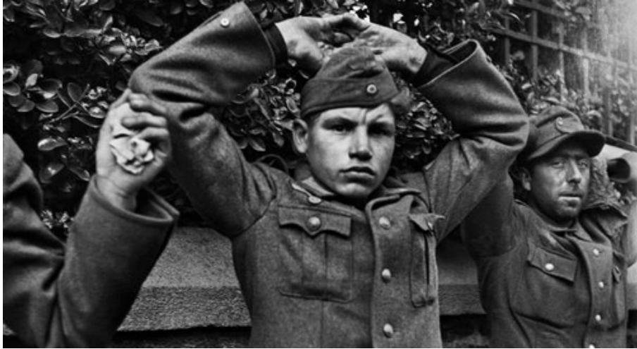
Jeune soldat allemand prisonnier, près de Saint-Malo, Bretagne, 9 août 1944

https://img.lemde.fr/2014/08/12/605/0/3543/1772/664/0/75/0/ill_4470573_dc7a_liberation3.jpg