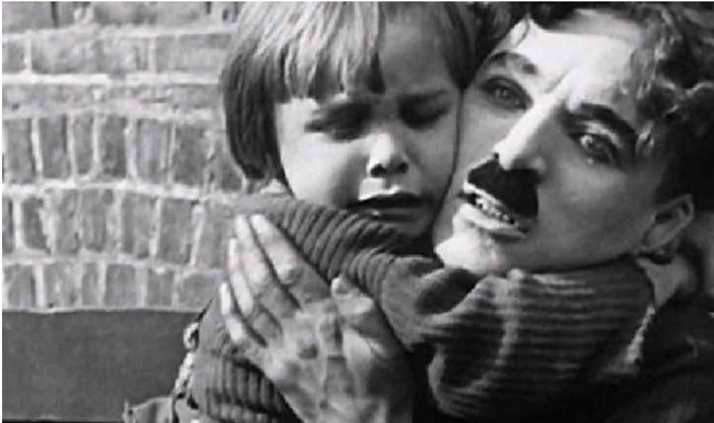
Photogramme du Kid, Charlie Chaplin, Jackie Coogan et Charlie Chaplin